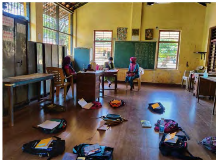
La nueva norma con diez estudiantes