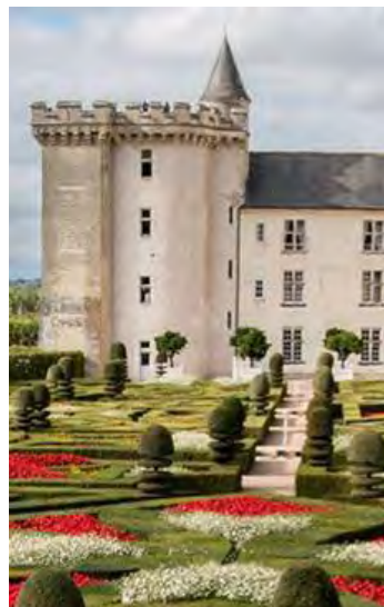
El castillo de Villandry