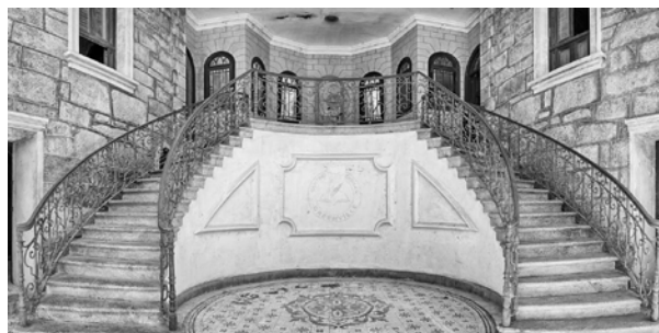
La escalera de entrada