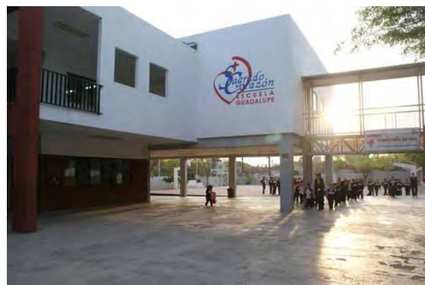
Colegio del Sagrado Corazon en la Ciudad de Mexico

. Bienvenida nuevas exalumnas y exalumnos buscamos tener una credencial única a nivel nacional que nos identifique como exalumnos de alguno de los Colegios del sagrado Corazón en México. Esta iniciativa ya se está llevando a cabo en algunas ciudades.