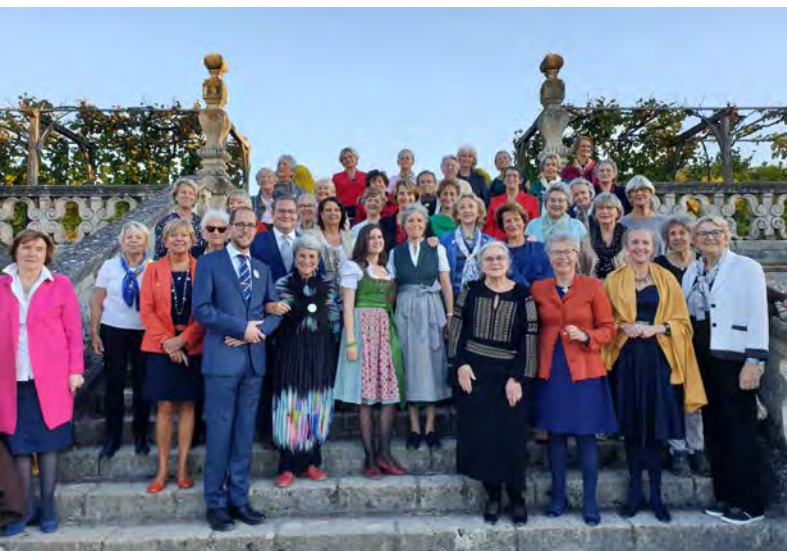
El grupo de participantes en el Congreso de Tours